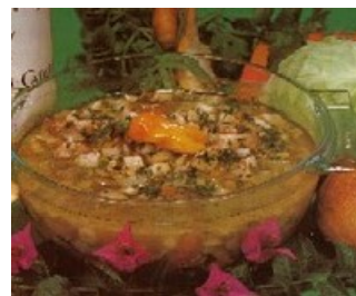
Le bébélé traditionnel de Marie-Galante

Des commentaires ? Des suggestions ? n'hésitez pas à nous écrire.