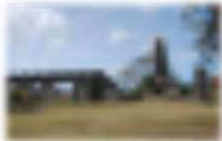
L'usine sucrière conserve l'emplacement des sodas des machines, on distingue aussi les ruines de l'ancienne distillerie.