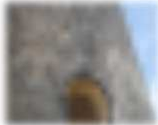
Le moulin frappé par la foudre il y a deux, trois ans a été très bien rénové.

Domaine classé Monument Historique en 1981, il comprend de remarquables vestiges, les Grandes Écuries, un moulin en pierre de taille, original tant par son socle surélevé que par sa volée de marches en briques rouges, une haute cheminée, une belle auge en pierres taillées, le tout au sein d'un très beau parc et bordé d'une mare.