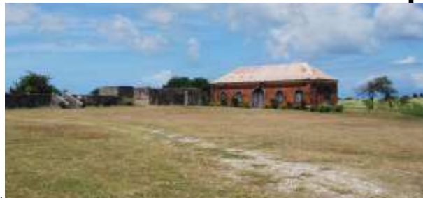
Les grandes écuries en briques rouges nous font ressentir la richesse de l'habitation d'autrefois, elles étaient attenantes à la maison de maître en bois, disparue aujourd'hui.