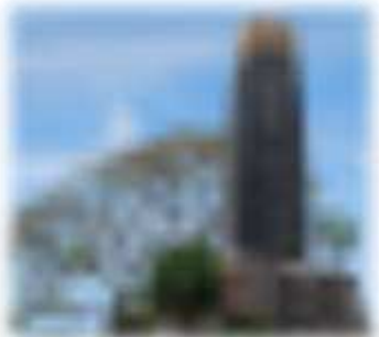
Batie en 1845, sa base est en pierre de taille et on distingue une large corniche en briques ocre.